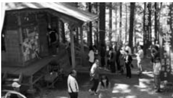
多くの参拝客が訪れた例祭

好天に恵まれたこの日は、杉木立の中をゆっくりと散策する人もあり、終日参拝客らでにぎわいました。