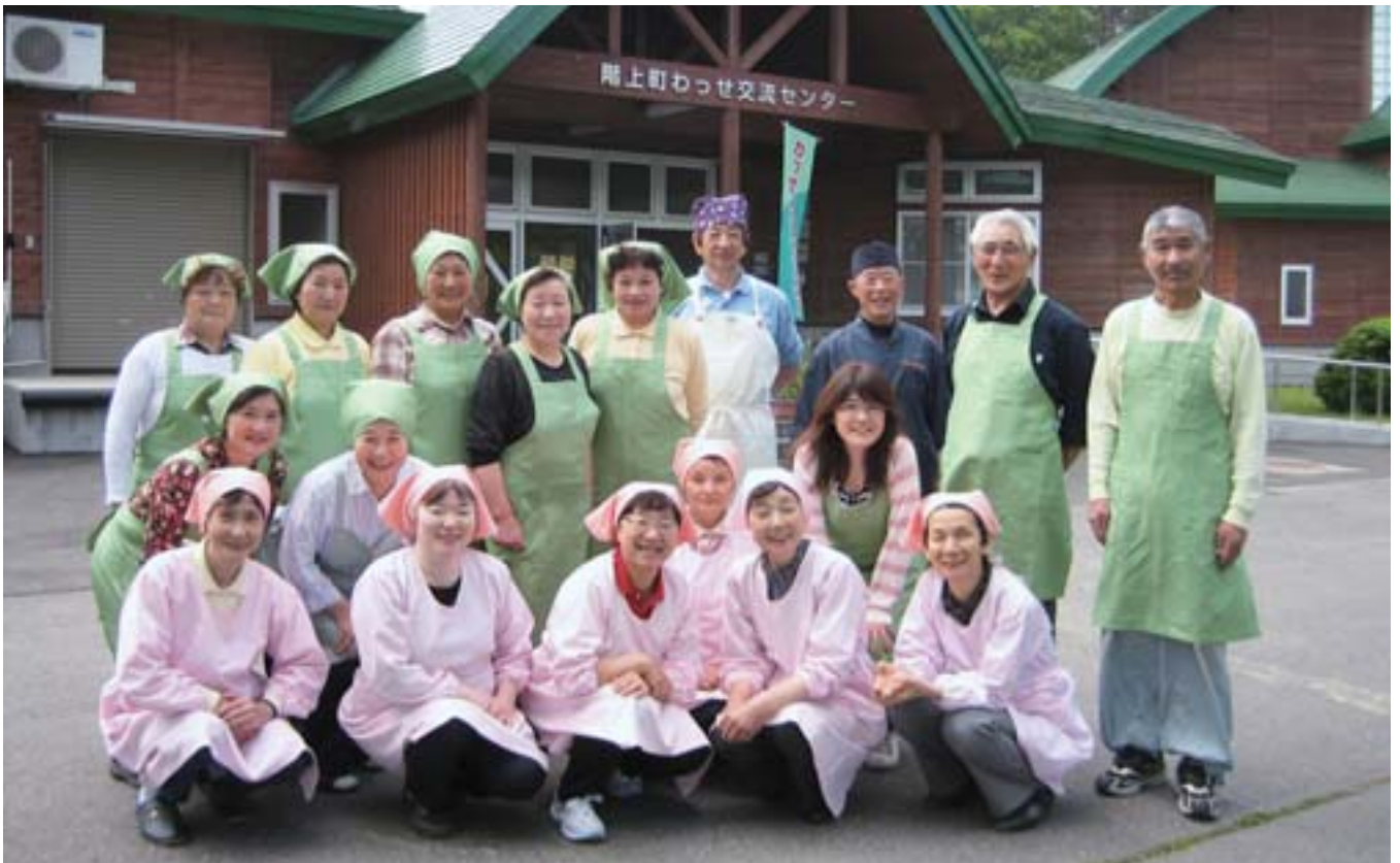
わっせ交流センター運営協議会の皆さん