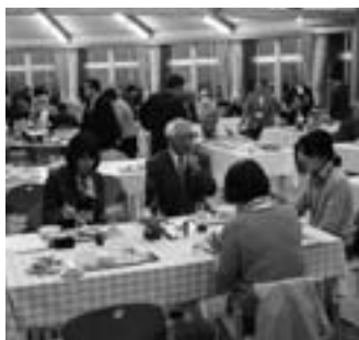
郷土料理や地酒を囲み、東北各地で廃校を活用している団体と情報交換が行われた交流会

廃校となった学校の有効活用をテーマに「第4回よみがえる廃校全国サミット」が4月28日、わっせ交流センターで開かれました。