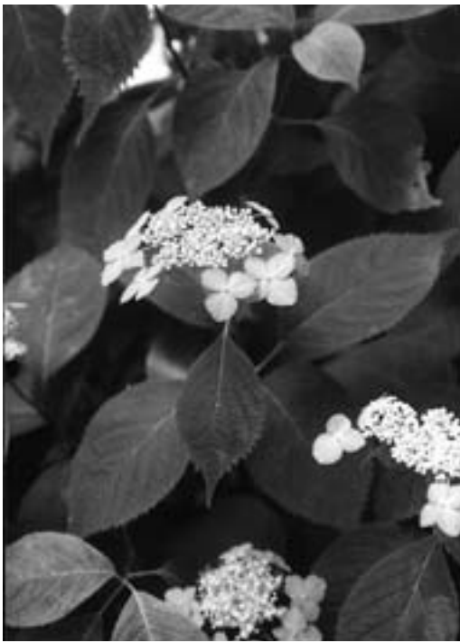
ほのかな青色の花

静かに咲いているさまは、清らかさがある。装飾花の数が多くないのも山の植物としての情緒を醸し出す。