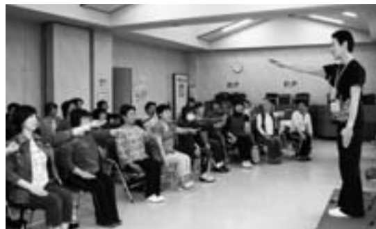
自らも健康に。健康体操を体験する健康推進員

町では、40～50代の男性の受診が低いことが課題となっており、今後、委員は各地区で健診の受診勧奨を行い受診率向上に努めていきます。