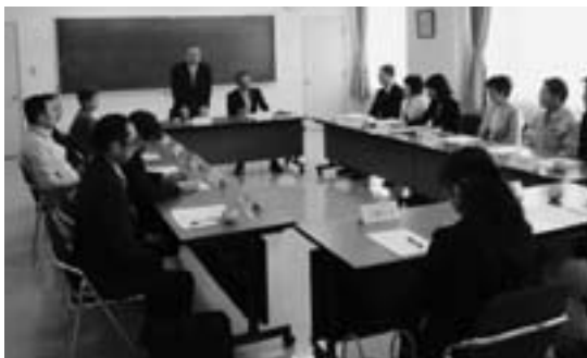
町内介護事業所代表者が一堂に会した

今後は、定期的に会合を開き、事業所間の情報共有を図りながら、町民に対する介護保険サービスのさらなる向上を目指していきます。