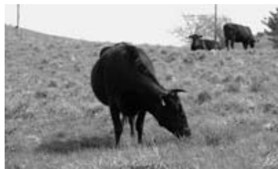
のんびり草をはむ牛

放牧場の利用は10月31日まで。今後も町内や八戸市南郷区の農家から順次入牧し放牧される予定です。