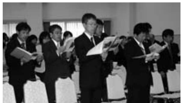
町民憲章を唱和する参加者