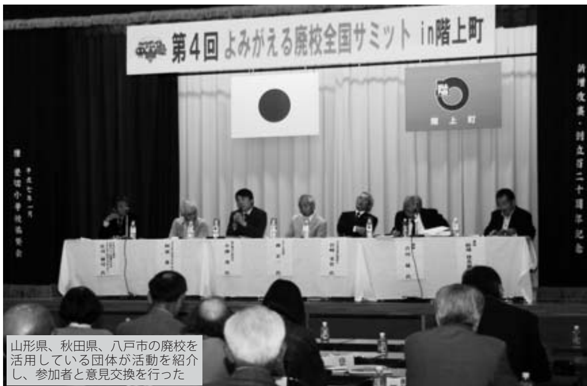
山形県、秋田県、八戸市の廃校を活用している団体が活動を紹介し、参加者と意見交換を行った