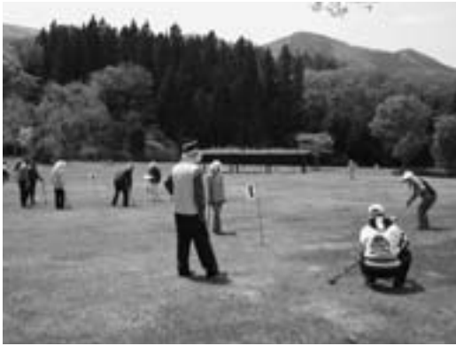
緑に囲まれグラウンドゴルフを楽しむ

公園はどなたでも利用でき、4月以降は、町グラウンドゴルフ協会や町体協主催の大会、また公園を維持管理している鳥屋部地区まちづくり推進委員会の親睦と健康増進グラウンドゴルフ大会などに利用されています。団体は申し込みが必要です。問い合わせは産業振興課まで。