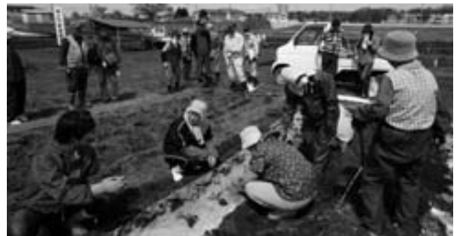
野菜づくりのポイントを聞く農園利用者

開園式には約30人が参加。町職員から農園利用について説明を受けた後、野菜栽培講習会を開催。参加者は、農業経営アドバイザーや臥牛の郷生活研究連絡協議会から指導を受けながら、病害虫防除の仕方やキャベツ、レタスなどの栽培方法について学びました。また、利用者が育てた野菜は11月に行われる町民文化祭で展示される予定です。