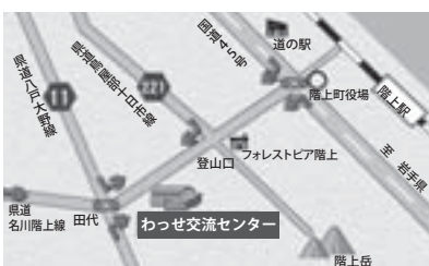
所在地 大字平内字上道1-1

登山口から南郷区方面に約3.5キロ、いくつかのカーブの先に赤い風見の屋根が緑の中にひと際目立ちます。4月29日にグランドオープンを迎えた「わっせ交流センター」。一体どんな施設なのでしょう。