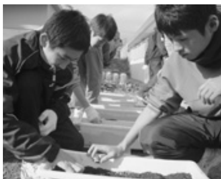
球根を植える生徒(左が階上町の生徒)。両校の交流は今後も続けられる