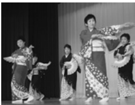
多彩なステージで聴衆を楽しませた