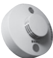
住宅用火災警報器

隔で鳴る)のときは、新しい電池に交換する。 ■タバコの煙、調理時の湯気や煙、ほこりなどが原因で警報が鳴ることがあります。火事でないことが確認できたら「警報音停止ボタンを押す」「引きひもを引く」または「部屋の換気」をして音を止めましょう。 ■交換 交換期限(製造年月から10年)は機種により異なります。機器に表示されている交換期限、または機能の異常警報が出たときは、本体ごと交換してください。