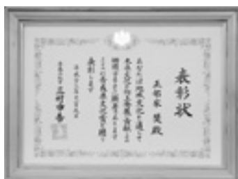
受賞し、褒状を手にする正部家さん。左は県文化表彰状