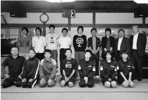
階上町選手団の皆さん

第21回青森県民駅伝競走大会（9月1日、正午スタート）に参加する階上町選手団が決定しました。当日は、青森市のアスパムをスタートし、県陸上競技場をゴールとする8区間（33.8km）をたすきでつなぎます。大会の様子はテレビ中継されま す。選手への温かいご声援をお願いします。