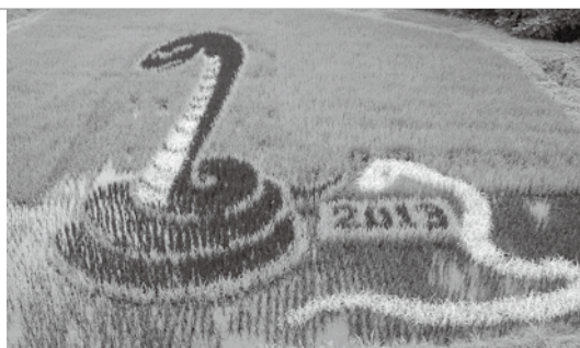
黒と白 二匹の蛇 ※7月25日撮影