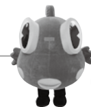
はしかみキッズ あぶらめくん