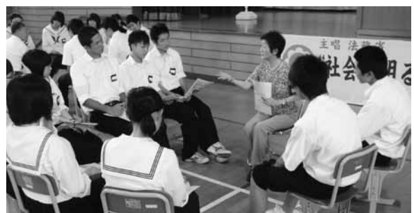
保護司の話を熱心に聞く生徒たち

「保護観察中に再び罪を犯してしまったとき」などと話し、生徒は、保護司の活動に理解を深めていました。