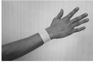
反射材は車のライトを反射し、夕暮れ時や夜間の交通事故防止に役立ちます。