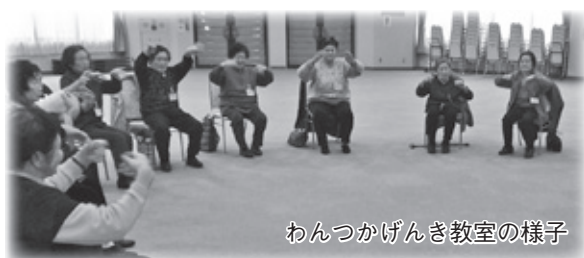
わんつかげんき教室の様子

基本チェックリスト（心身の状態を見るための25の質問項目）から介護予防が必要と判断された人のことです。