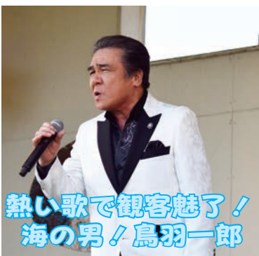
熱い歌で観客魅了！ 海の男！鳥羽一郎