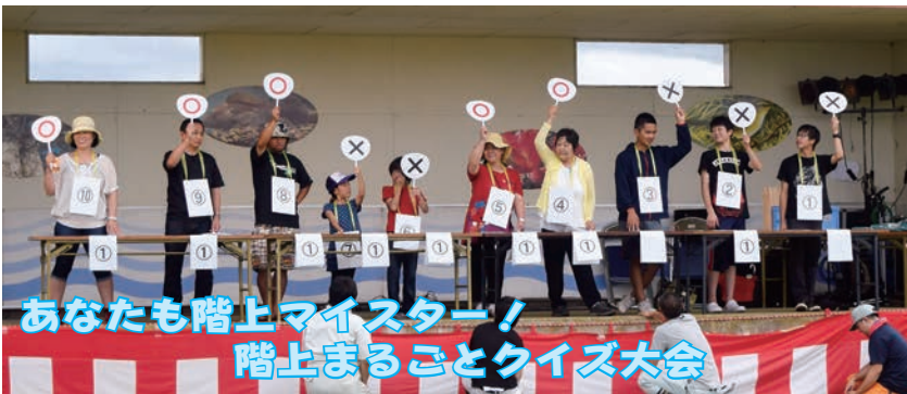
あなたも階上マイスター！ 階上まるごとクイズ大会