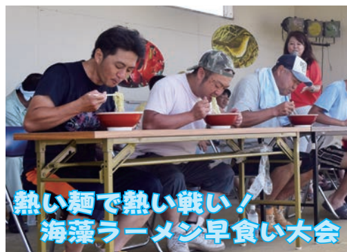
熱い麺で熱い戦い！ 海藻ラーメン早食い大会