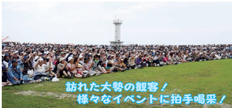
訪れた大勢の観客！ 様々なイベントに拍手喝采！