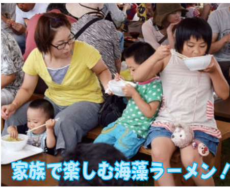
家族で楽しむ海藻ラーメン！

会場は特産のいちご煮や、ウニなどの新鮮な海の幸を求める人でにぎわい、元祖いちご煮は2日目の午前中に完売するなど大盛況。階上町自慢の味は、訪れた人たちに笑顔を広げました。