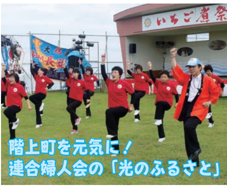
階上町を元気に！ 連合婦人会の「光のふるさと」