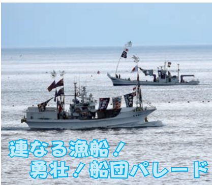
連なる漁船！ 勇壮！船団パレード