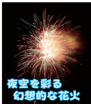
夜空を彩る 幻想的な花火