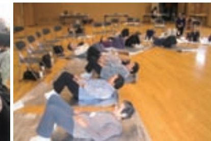
わんつかげんき教室