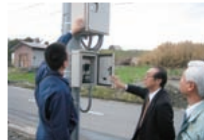
コミュニティ防災無線