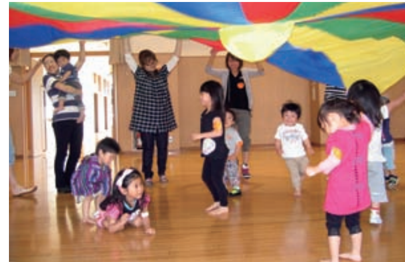
わいわい子育て広場