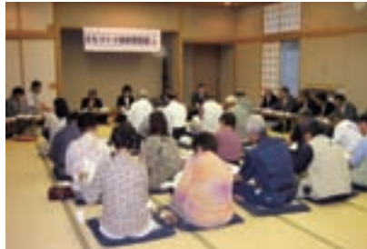
まちづくり地域懇談会