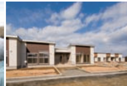
町営住宅榊山団地