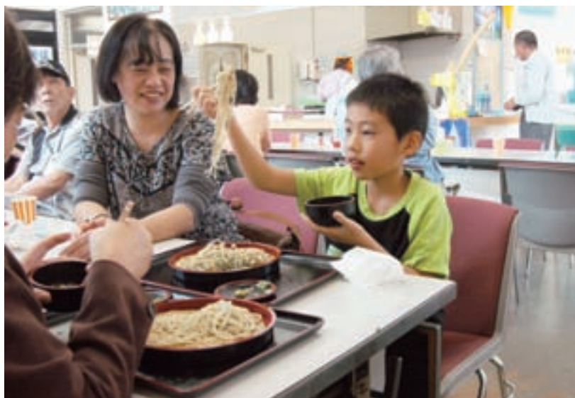
新そばまつり（道の駅はしかみ）