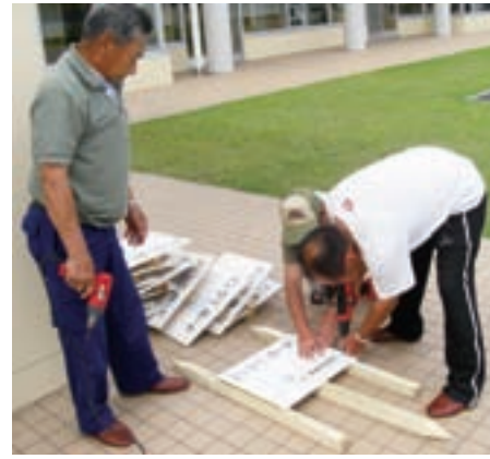
石鉢学区あいさつ運動

施策は、①協働のまちづくりの推進を図ります。②地区まちづくり計画の推進・支援の充実を図ります。