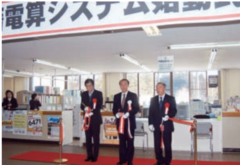
戸籍事務の電算化