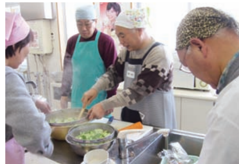
男の食力アップ教室