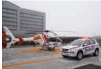
ドクターヘリ、ドクターカー