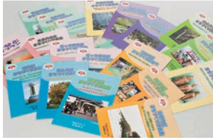
「地区まちづくり計画」