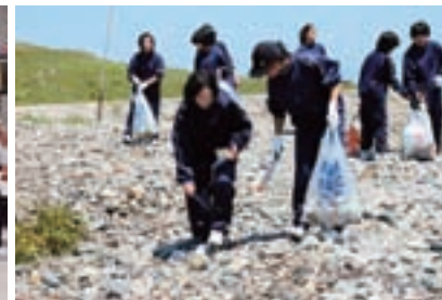
道仏中学校生徒による清掃活動