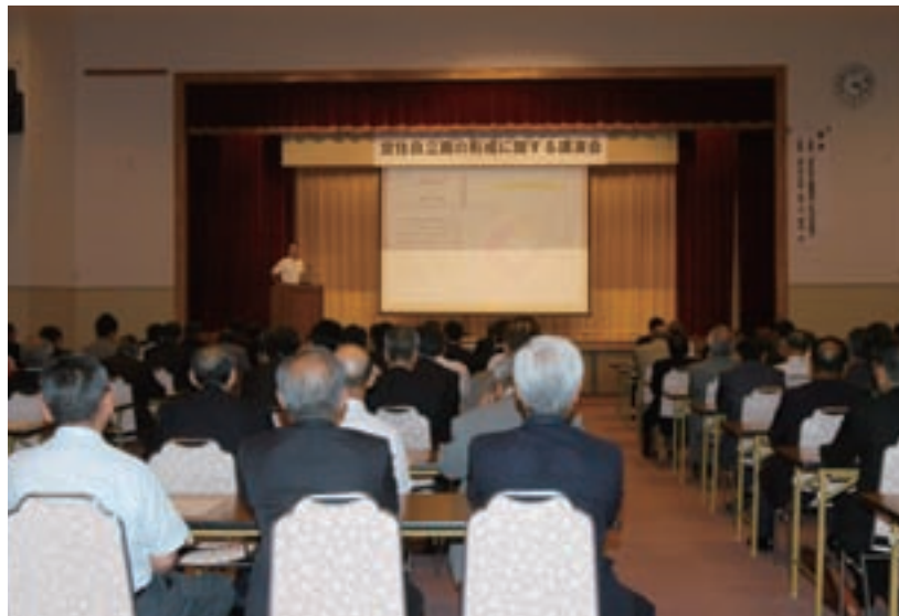
定住自立圏の形成に関する講演会