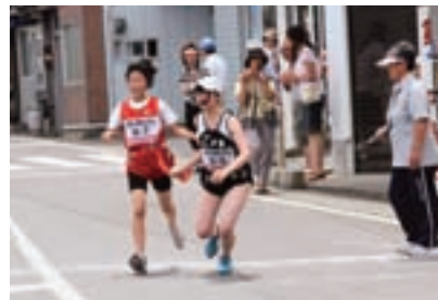
町内駅伝競走大会