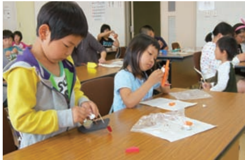
「わんぱく王国」で体験学習