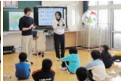
外国語指導助手（ALT）による授業