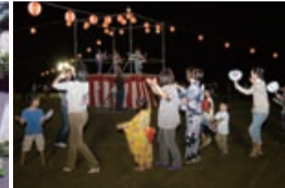
鳥屋部盆踊り大会