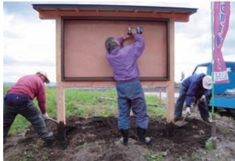
協働のまちづくり支援事業（大蛇地区掲示板製作）