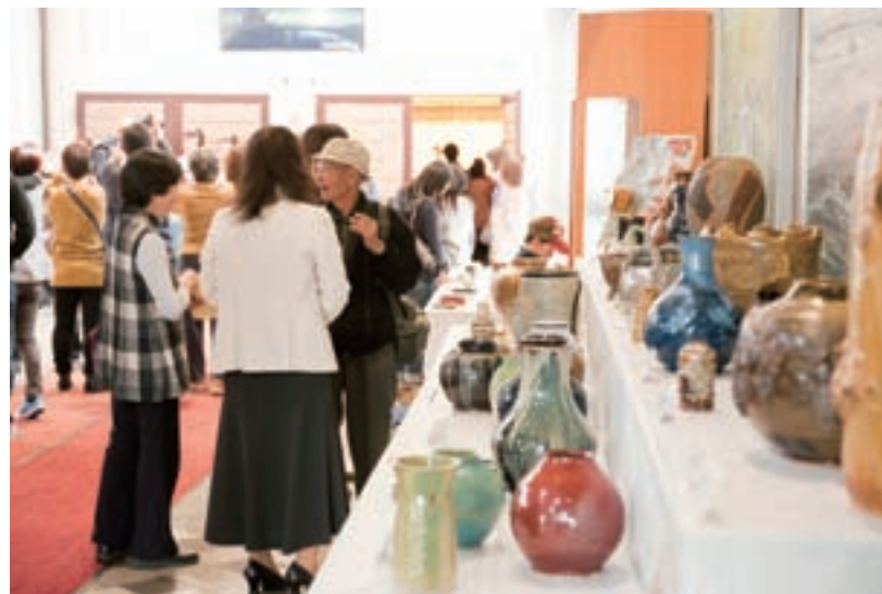
町民文化祭での展示